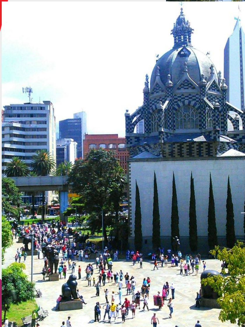
Praça Botero e Centro de Cultura